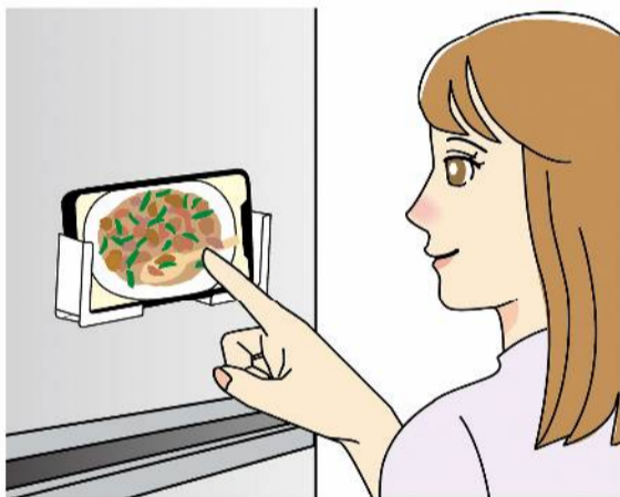
ホルダーは冷蔵庫などに貼りつけ、見やすい位置にセッティングすればOK！

いろんなレシピサイトがあり、テレビ番組の料理コーナーでもHPでレシピを公開している、スマホを見ながら料理をする人も多いのでは？そこで、マグネット式のホルダーを活用すれば、マグネットを使える場所に固定した状態で見ることができま。