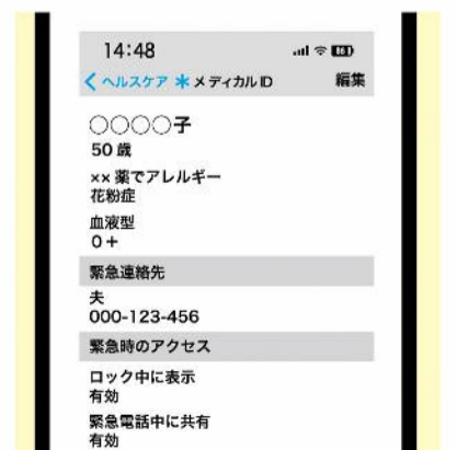
iPhone版のメディカルIDの例。アレルギーなどの情報のほかに、緊急連絡先なども入力できます！

スマホに血液型やアレルギー情報、常用薬を入力しておく、災害時や緊急搬送の際に安心。ぜひ、お守りとして入力しておきましょう。 ・アンドロイド：設定→デバイス情報→緊急時情報→情報を追加する「+」 ↓名前、血液型、アレルギーなどを登録