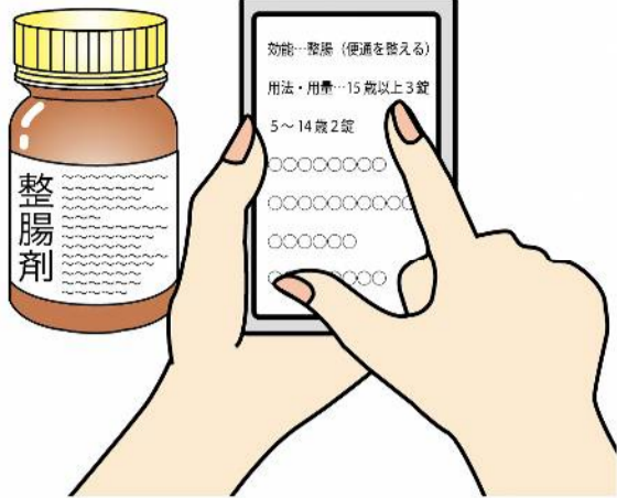
文字が小さい薬の説明書きも写真に撮って拡大すれば見やすい！