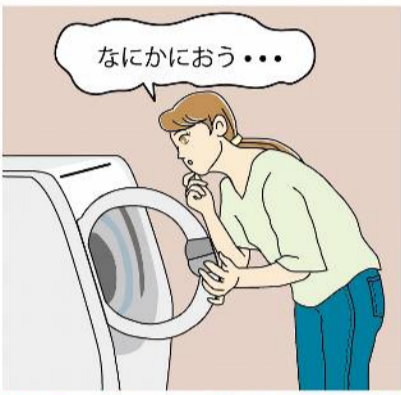
焦げ臭いにおいは、洗濯機内部の部品が摩耗している可能性があり、危険です。ただちに使用をやめてメーカーに相談することをおすすめします。

操作パネルが反応しないときは、電源プラグを抜き、10分ほど置いて再度接続しても改善しなければ、寿命の可能性が。6年以上使用している