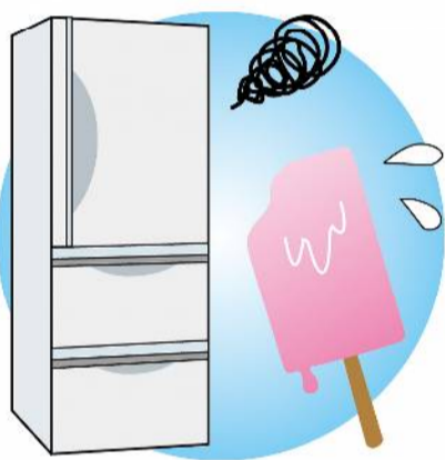
アイスなどが溶けてしまうなど症状があれば、内部の機械や部品の不具合の可能性。メーカーや電気屋さんにご相談を

冷えない、冷えが悪い場合は、食品を詰め込みすぎて冷気の出口を塞いでいないかチェックを。また、ドアパッキンの劣化の場合もあります。冷気の出口を確認し、冷気が正常に出ている