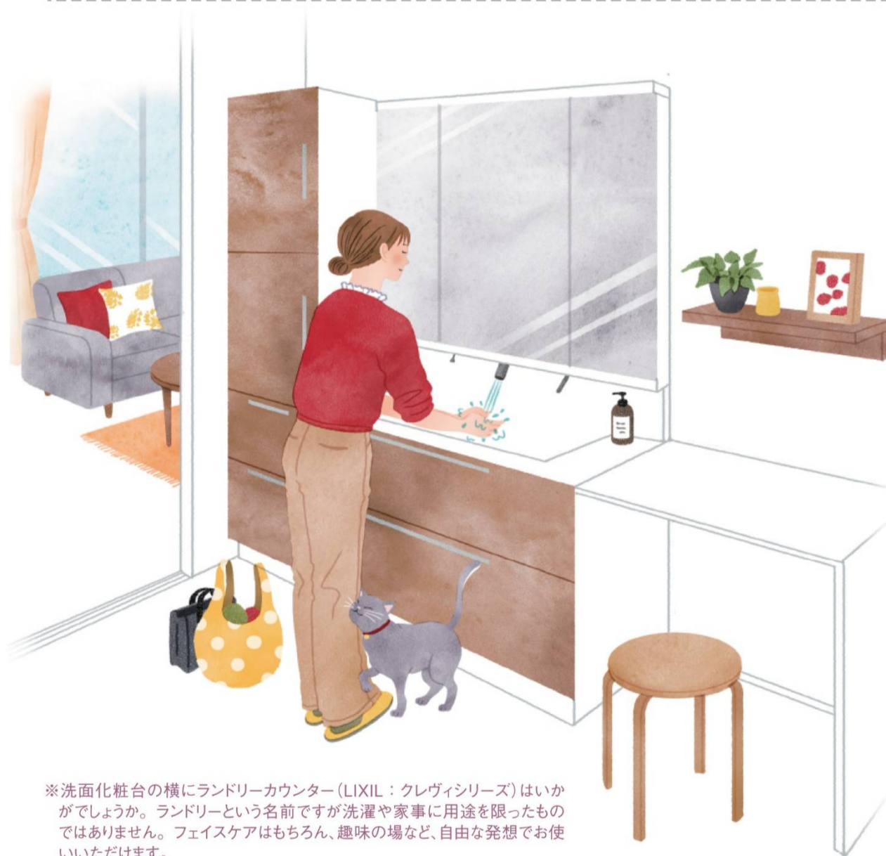
※洗面化粧台の横にランドリーカウンター(LIXIL:クレヴィシリーズ)はいかがですか。ランドリーという名前ですが洗濯や家事に用途を限ったものではありません。フェイスクアはもちろん、趣味の場など、自由な発想でお使いいただけます。

本格的な洗面化粧台ではなく、シンプル、小ぶりの「2つ目」の手洗器です。手軽に施工でき、比較的安価に設置できるのも魅力です。 朝、家族が洗面に集中する「混雑問題」の緩和に、家事をちょっと便利にするためのアイデアをぜひお試しください。