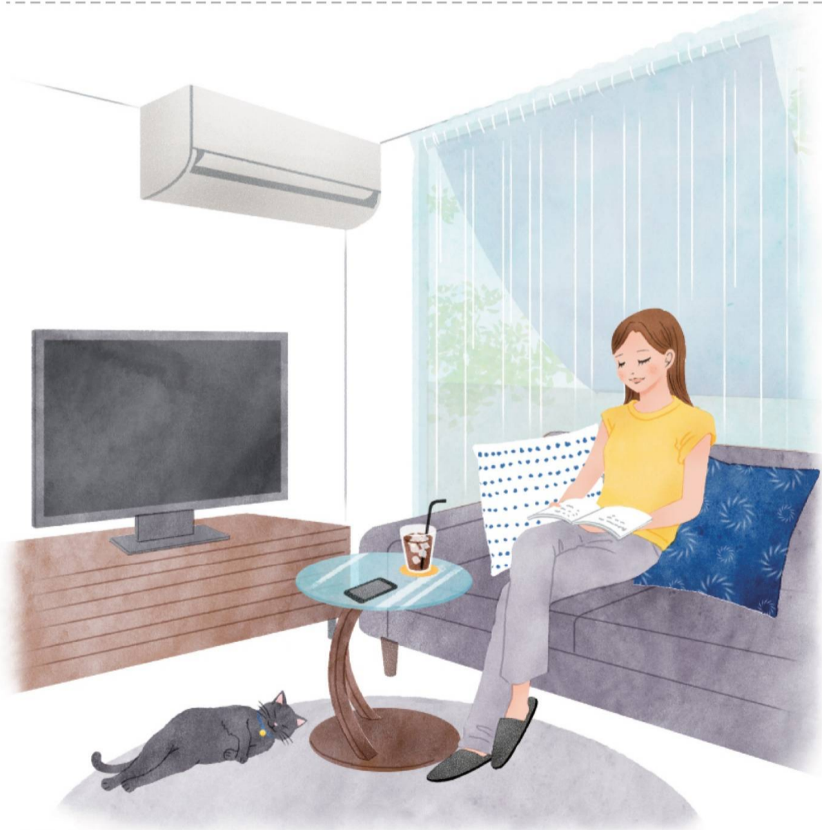
【出典】経済産業省 夏季の省エネ・節電メニュー(令和4年6月) 経済産業省 資源エネルギー庁『省エネ性能カタログ家庭用』2022年版

同じ家電でも、使い次第で電気料金はずいぶん変わります。今年の夏は、省エネ家電への乗り換えも考えてみては？