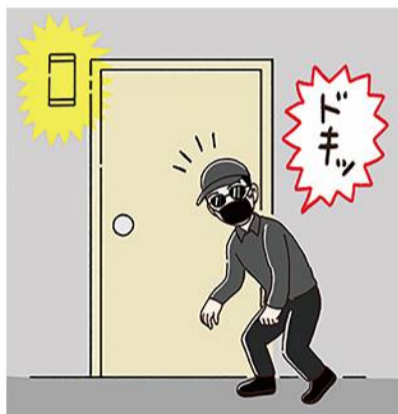
人感センサーライトや、カメラ付インターホンも、警戒心を高める心強いアイテムです。

●窓の防犯性を高める…防犯合わせガラスに変更したり、内窓を設置することで、侵入までの時間を稼ぐことができ、侵入を諦めさせる可能性も。最近では、在宅時でも関係なく侵入するパターンもあるので、防犯性の高いシャッターを設置し、部屋に人がいないときは閉めておくという方法も。面格子もおすすめです。 ●長時間いない場所の窓に気をつける…浴室やトイレの窓は、換気などで