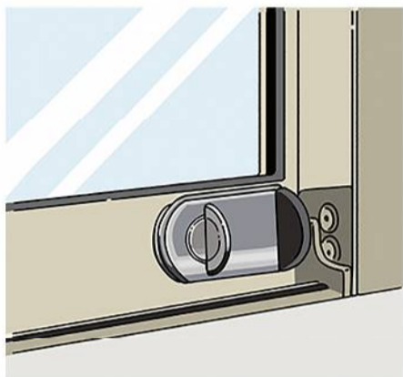
補助錠は、窓にも効果的。外から見えづらいモノも。ホームセンターなどでチェックしてみてください。

●玄関ドアの防犯性を高める…ディンプルキー、ウェーブキーといった、防犯性能の高い鍵に変えたり、防犯性能の高い鍵が付いた玄関ドアに変えるという手もあります。玄関ドア自体も一新できるのでおすすめです。