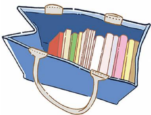
デザインが気に入ってるけど外出にはもう使えない...というバッグは収納アイテムとして活用する手も！