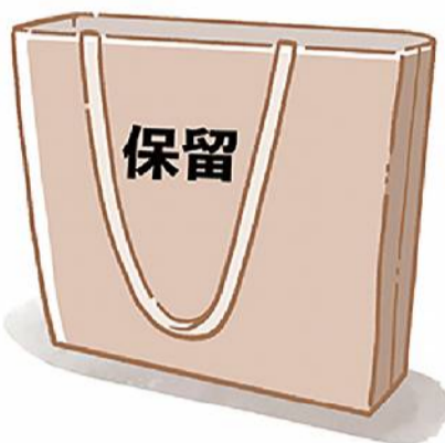
捨てられないときは、別の場所に一時保管して判断を。半年～1年放置状態なら手放しやすくなります。

が高いな」と感じたら、引き出し一つ、カゴ一つから始めてみましょう。まだ食べられるものはカゴや引き出しに戻す。これを時々、少しずつ続け、ある程度見極めが終わったら、乾物、インスタント、レトルト、お菓子という感じで分ければ、見やすくなり、ムダ買いも減ります。