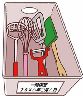
保留のモノはその入れ物に整理した日付を書くと、どれくらい置いたか確認でき、処分の目安になりますよ。

文房具もおすすめ。家の各所にペンやはさみなどが置かれていませんか？それらを集めて、すべて広げてみましょう。リピングやキッチンなど、ペンやはさみはいくつ必要か、行動を思