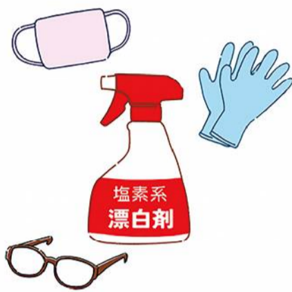
塩素系漂白剤はゴム手袋やメガネ、マスクなどをしてご使用を。