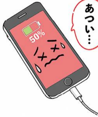
バッテリーのダメージに気を付けて、スマホを長持ちさせたいですね。