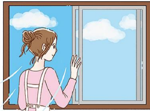
適度な換気も大切。掃除の際や部屋を移動するときなど、ちょっとした合間にする、おっくうになりませんよ。

気店に問い合わせ合わせてみるのも良いですね。 ホットカーペットは、足元を温めるのに、とても助かります。しかし、長時間使用すると電気代がかかるので、半分だけ温める機能や省エネモードを使うと良いですよ。ひざ掛けや毛布の併用もおすすめ。また、専用のカバーかホットカーペット対応ラグをかけて使うようにしましょう。