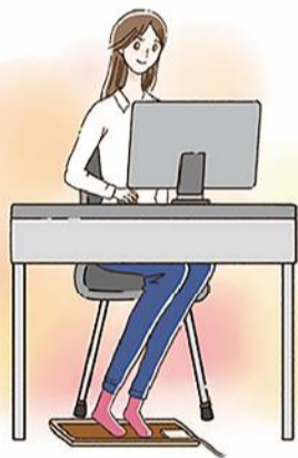
足元に置いて使うミニサイズのホットマットはリモートワークにおすすめ！効率良く足元を温めることができます。

気店に問い合わせ合わせてみるのも良いですね。 ホットカーペットは、足元を温めるのに、とても助かります。しかし、長時間使用すると電気代がかかるので、半分だけ温める機能や省エネモードを使うと良いですよ。ひざ掛けや毛布の併用もおすすめ。また、専用のカバーかホットカーペット対応ラグをかけて使うようにしましょう。