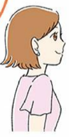
美術館や映画館で涼みながら芸術に触れるのも良いですね！

ほかにもちよつとの工夫で節電に。カーテンやブラインドで直射日光を防ぐとお部屋の快適さもアップ。遮熱カーテンもおすすめです。暑いと冷蔵庫を開ける回数も増えますが、開けると冷気が外に漏れ、閉めた時に冷やそうと電力を消費するので、開閉の回数を減らすことも大切です。電力に頼らないアイテムを使うのもおすすめ。涼感タイプの敷きマット