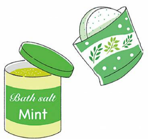
清涼感のある夏向けの入浴剤が豊富にあるのでチェックしてみてください

ほかにもちよつとの工夫で節電に。カーテンやブラインドで直射日光を防ぐとお部屋の快適さもアップ。遮熱カーテンもおすすめです。暑いと冷蔵庫を開ける回数も増えますが、開けると冷気が外に漏れ、閉めた時に冷やそうと電力を消費するので、開閉の回数を減らすことも大切です。電力に頼らないアイテムを使うのもおすすめ。涼感タイプの敷きマット