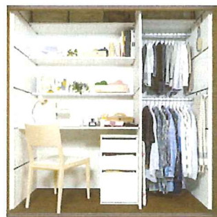
写真・記事：株式会社 LIXIL