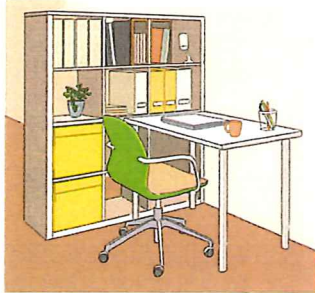
観葉植物や写真を飾るなど、好きなモノを凝縮させるのも素敵♪

いなら、椅子は疲れないタイプを選ぶのがおススメ。背もたれがメッシュになった、背中が蒸れないタイプや、リクライニングができるものなど、自分に合ったものを吟味しましょう。