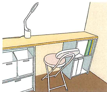
カラーボックス2つに天板を渡せば、省スペースで収納兼デスクが実現！

ブルを使えば、一石二鳥ですね。ダイニングテーブルの一角を仕事や趣味スペースとして使う場合は、テーブルの上にモノを出しっぱなしにしないことが鉄則！モノが出しっぱなしになると、一気に雑多な雰囲気になります。そこで、ダイニングテーブルのサイドや、背面に収納家具を置き、さらに、どこに何をしまおうか、分類できるようにすることで、必要なモノがすぐ出し入れでき、散らかり防止になります。 小さい空間でもいいから自分のスペースが欲しい！ということなら、奥行きが浅いコンソールテーブルや、壁面に設置でき、必要なときだけ使える折り畳み式のテーブル、はしご型の机などを活用するのも手です。収納と机が一体型になったライティングビューローもおススメ。ライティング ビューローは、アンティーク家具としても人気が高いので、リサイクルショップやインターネットなどで探してみてもいいかもしれません。また、収納家具は奥行き30センチ程度のコンパクトさで、1つの収納枠のサイズが正方形タイプのレイアウト自在なオープン収納が大手雑貨メーカーで見られ、省スペース化に重宝するので、チェックしてみてもいいですね！