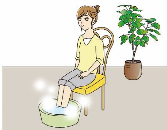
ちょっと疲れたな、というとき、手湯や足湯でゆったりリラックスしてみるのも良いですね。

朝、起きたての1杯の水や白湯の代わりにホット炭酸水を飲むと炭酸の作用によって血行も促進されるとか。コップ1杯なら、電子レンジ600Wで30秒程度が目安。40℃前後に温めるのがおすすめです。 ・ホット炭酸水は手湯や足湯にもおすすめ…炭酸ガスが皮膚から浸透し、血管が開きやすくなり、血行が促進されるそうです。冷え性対策にも良いですね。1回、だいたい15分程度が