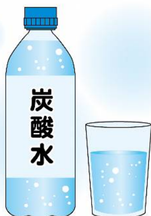
炭酸水は飲みすぎると、過剰に刺激される可能性がありますのでご注意ください。

朝、起きたての1杯の水や白湯の代わりにホット炭酸水を飲むと炭酸の作用によって血行も促進されるとか。コップ1杯なら、電子レンジ600Wで30秒程度が目安。40℃前後に温めるのがおすすめです。 ・ホット炭酸水は手湯や足湯にもおすすめ…炭酸ガスが皮膚から浸透し、血管が開きやすくなり、血行が促進されるそうです。冷え性対策にも良いですね。1回、だいたい15分程度が