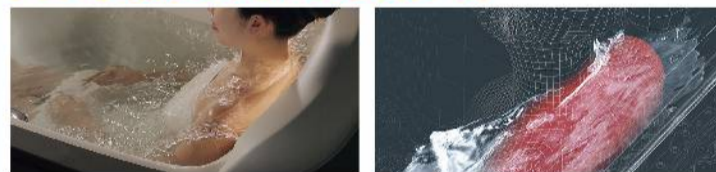
Aqua Feel [肩湯] あたたまる湯のベールで、心からリラックスできる