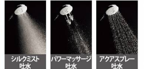
シルクミスト吐水 パワーマッサージ吐水 アクアスプレー吐水