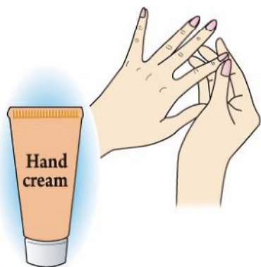
水仕事や手洗い、消毒で手肌の乾燥も気になりますね、ハンドクリームを指先までしっかり塗って保湿をしましょう。

腕は手先から二の腕に向かって丁寧に塗りましょう。足はリンパの流れを意識して足先から太ももに向かって塗ります。皮脂腺や汗腺が少なく、乾燥しやすいひじ、ひざ、かかとは尿素入りクリームを使うとなめらかなお肌が目指せます。ひじやひざは手足を曲げて円を描くように伸ばすとシワの間にもクリームが行き渡ります。ボディオイルもおすすめで、手になじませてから使用を。入浴後に、濡れたまま使えるタイプもあります。