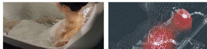
Aqua Feel [肩ほぐし湯] 湯の膜に隠された、リズムカルなウェーブ状の吐水が心地よい