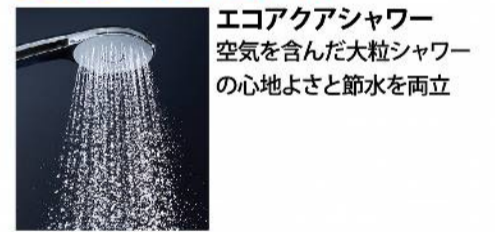
エコアクアシャワー 空気を含んだ大粒シャワーの心地よさと節水を両立