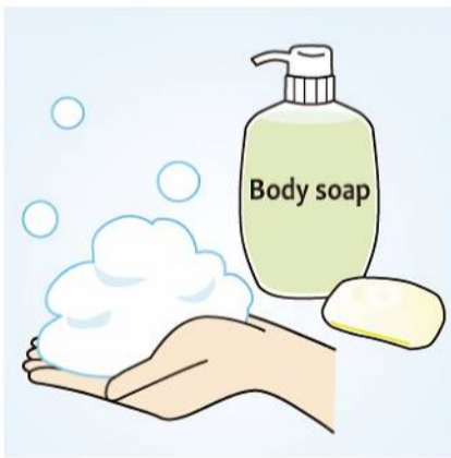
石けんやボディソープは、良く泡立てて使うことで肌への摩擦を軽減させ、乾燥対策につながります。

腕は手先から二の腕に向かって丁寧に塗りましょう。足はリンパの流れを意識して足先から太ももに向かって塗ります。皮脂腺や汗腺が少なく、乾燥しやすいひじ、ひざ、かかとは尿素入りクリームを使うとなめらかなお肌が目指せます。ひじやひざは手足を曲げて円を描くように伸ばすとシワの間にもクリームが行き渡ります。ボディオイルもおすすめで、手になじませてから使用を。入浴後に、濡れたまま使えるタイプもあります。