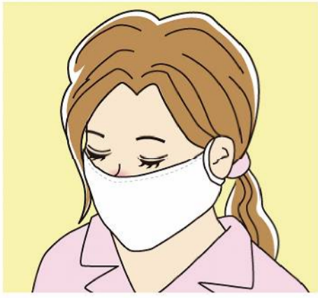
マスクは不織布が手軽ですが、シルクや綿が素材の一部に使われているタイプはよりお肌に優しく、おすすめです。