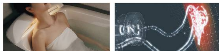
Aqua Feel [腰ほぐし湯] 湯の刺激で、背から腰の筋肉を、やわらげてほぐす