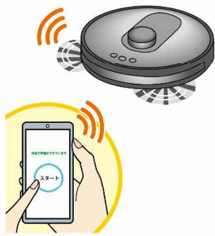
スマホと連動できるタイプなら、お出かけ中でもスマホからスタート！

て以上の家でも各階に持ち運ばば掃除してくれるので、掃除の時間を軽減することができます。 ・掃除範囲によって機種を選べる…コンパクトな部屋を掃除するなら、一般的なタイプで十分。複数の部屋を掃除する場合は、部屋の間取りを認識できる内蔵のセンサーがついたタイプがおすすめです。 ・拭き掃除ができるタイプも…ゴミを吸い込んだ後に拭き上げるため、雑巾がけの手間が省けます。