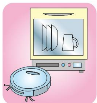
家電のレンタルサービスが広がっています。大手家電メーカーでは、サブスクも。興味があれば、短期間だけ試してみるのも良いですね！

れるので大助かり…食後の時間がゆったり過ごせ、食器洗い時の手荒れのリスクも減らせます。 ・高温のお湯で洗うので除菌できる。 ・少ないお湯で効率良く洗うので節水になる。 ・据え置き型もある…分岐水栓を設置するタイプや水を直接投入して稼働させるタンク式と、キッチンの状況によって選べます。