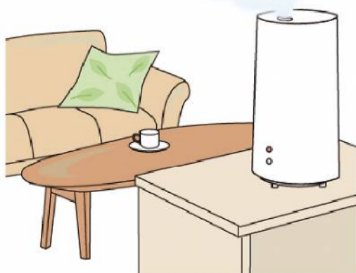
室内環境も大切！湿度は50～60%がおすすめ。適度な換気もお忘れなく！

土をすり合わせて全体になじませる ③残りのクリームを手の甲と手のひらですり合わせ、さらに全体になじませる ④手のひらで反対の手指1本1本を包むようにして指先まで塗りこみ、指の股や爪まわりも意識して塗る ほかに、喉を適度に潤してウイルスなどをスムーズに体外に排出できるように、こまめに水分補給をすることもおすすめします。