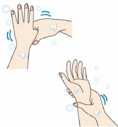
手洗いは、親指や手首もお忘れなく！優しくねじるように洗うと良いですよ！

手洗いもとっても重要ですね。帰宅したとき、食べ物を食べるとき、料理をするとき、動物をさわったときには、必ず洗いましょう。 洗い方の基本は、水で手を濡らしたら手洗い石けんをつけ、良く泡立てます。そこから手のひらと甲／指の間