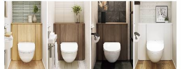
▲ライトオーク ▲ウォルナット ▲ショコラオーク ▲ホワイト