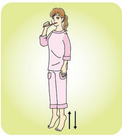
つま先立ちは、食器洗いなどの家事や歯磨き中にやってもOKです！

下半身に巡る血液を心臓へ戻すポンプのような役割を果たしています。ふくらはぎの筋肉を使ったエクササイズで血液の巡りを良くしましょう。 ●つま先立ちストレッチ：5～10秒、かかとを上げておろす動作を10回ほど。音楽のリズムに合わせて、左右交互にかかとの上げ下げをやるのもおすすめです。楽しみながらできます。