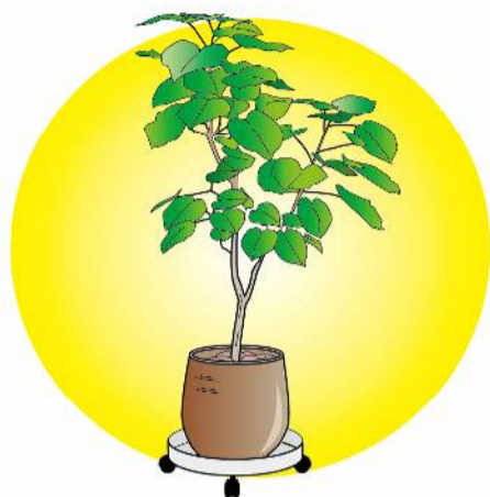
大きい観葉植物を移動させるのに、キャスター付きの鉢受けを使うと便利です。

印象的なアクセントにもなります。ただし、西日のあたる場所は、葉焼けなどの一因になるので、避けるのがベター。どうしても置きたい場合は、西日が当たる時間帯だけ少し移動させるか、レースのカーテンなどで日差しを避けることをおすすめします。