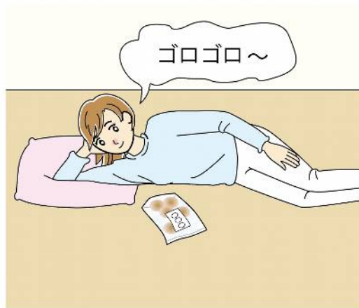
体がバテてしまう要因として、湯船に浸からず、疲れが取れづらくなることや、運動不足もあります。