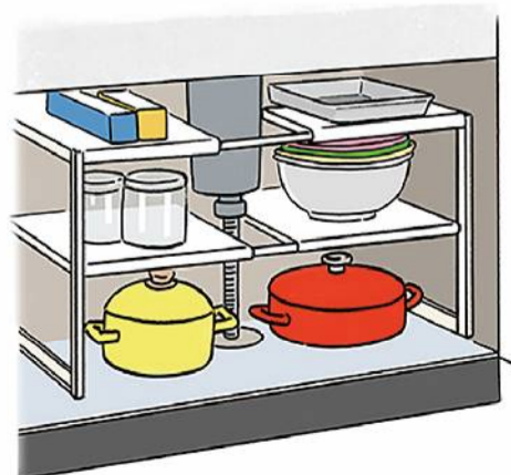
扉式の収納は、通気性に優れ、排水管を避けて設置できる棚で、鍋などを収納すると良いですよ。

水栓まわりも油断すると、溝などに汚れが溜まり、雑菌繁殖のリスクが。食器用洗剤を古歯ブラシにつけ、溝を軽く磨けば、キレイになります。野菜が入っていたネットの両端を持ち、溝に沿わせて左右に優しく動かしてもキレイになりますよ。 キッチン周りのコーキングは、ホコリや油汚れがつきやすく、油断するとカビが。まめにアルコールを吹きかけて拭きましょう。もし、頑固なカビが発生してしまったら、専用の洗剤で落としましょう。 ワークトップ下の収納内、特に、シンク下も気になります。モノを出してゴミやホコリを取り除いたら、中性洗剤で拭きましょう。調味料のボトルなども、アルコールで拭いてから戻すと良いですよ。