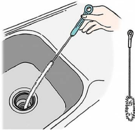
100円ショップでも見られる、長さのある排水管用のブラシで掃除すると、スッキリしますよ！

シンクは、食器用洗剤とスポンジでときどき洗いましょう。排水口の受け皿（ゴミかご）やフタも、まめに洗うと良いですが、放っておくと、カビやヌメリの原因に。もし、それらが発生したら、キッチンに使える塩素系洗剤を吹きかけ、洗剤の説明書にある時間のとおりに置いて、古い歯ブラシなどでキレイにしましょう。ビニールに受け皿やフタを入れて洗剤を中に吹きかけ、ビニールを気になる汚れの部分に密着させると、パックのような効果があつて落としやすくなり、塩素