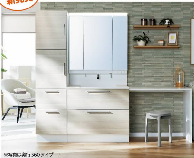
※写真は奥行560タイプ

新しい日常の暮らしに寄り添った洗面ドレッサーが誕生しました。モノをたっぷりしまえる奥行560タイプとコンパクトなサイズの奥行500タイプがあります。