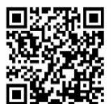
写真・記事：株式会社 LIXIL

間違いさがし答え：①女の子のスポンの長さ ②お父さんのメガネ ③女の子の背中にクッション ④後ろの紙パッカーペットボトル ⑤右のタンスの色が入れ替わっている