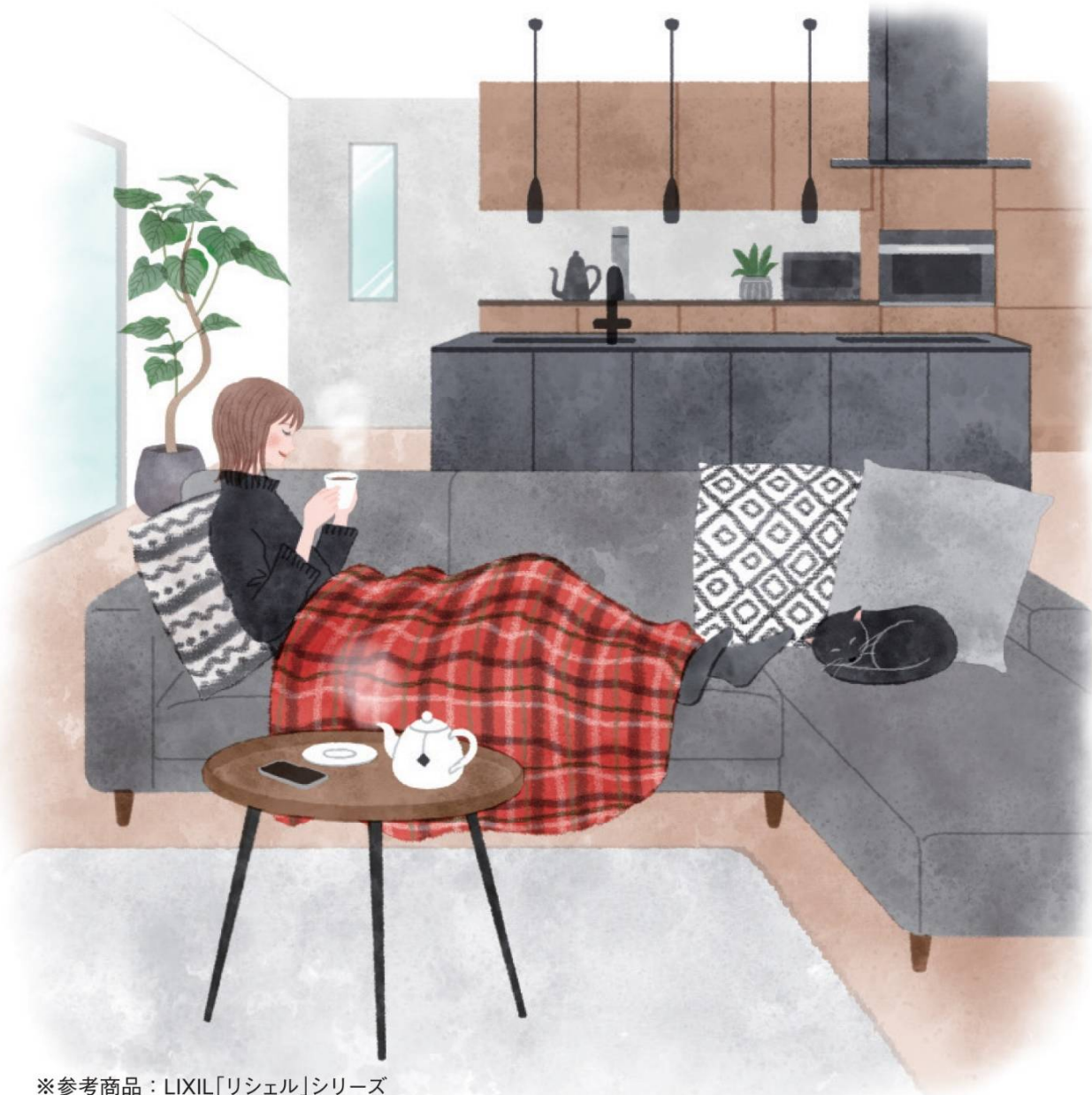
※参考商品：LIXIL「リシェル」シリーズ